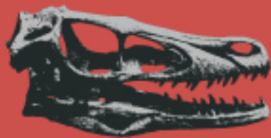
Fig. 1 Un teschio rettiliano